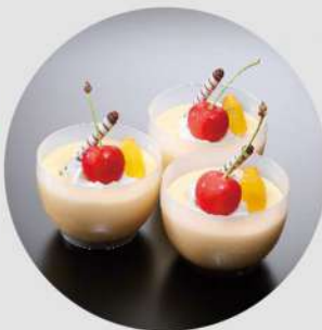
シェフズプリン (3個) 1,050円 (税込 1,134円)