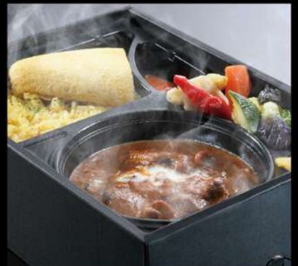
ビーフシチュー弁当