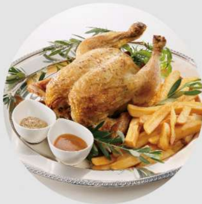
麦風鶏のローストチキン (1羽) 5,000円 (税込 5,400円)