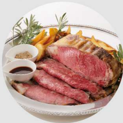
下野牛のローストビーフ (1kg) 12,000円 (税込 12,960円) (2kg) 19,500円 (税込 21,060円)