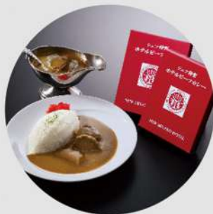
ホテルビーフカレー (1個) 600円 (税込 648円)