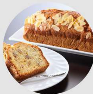
足利美人人参の パウンドケーキ (1本) 1,200円 (税込 1,296円)