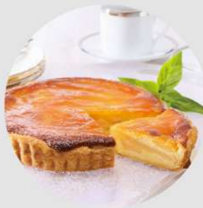
洋ナシのタルト 1,800円 (税込 1,944円)