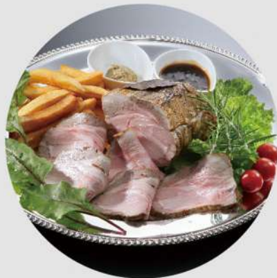
桜山豚ローストポーク (1kg) 5,000円 (税込 5,400円)