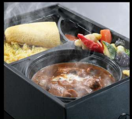
ビーフシチュー弁当